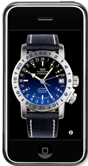
Vorderseite mit Anzeige der Uhrzeit und 2. Zeitzone.